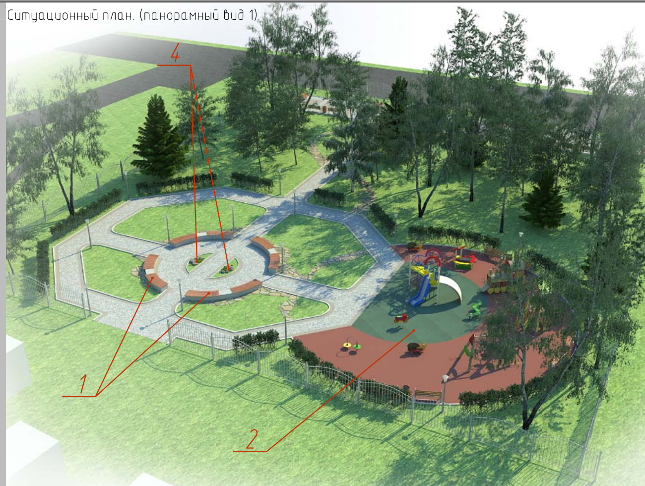
Ситуационный план. (панорамный вид 1)